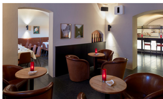
Clubraum Vorraum Clubraum mit Cotta-Bar